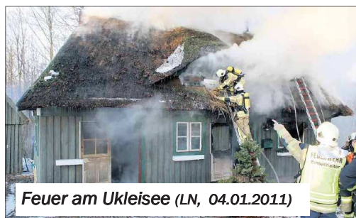
Feuer am Ukleisee (LN, 04.01.2011)

Ein Feuer hat in Stockelsdorf (Bilder oben) einen Kunststoff verarbeitenden Betrieb nahezu völlig zerstört. 16 Feuerwehren mit 200 Feuerwehrleuten waren eingesetzt. Zwei Feuerwehrleute wurden dabei verletzt, als es zu einer starken Verpuffung kam.