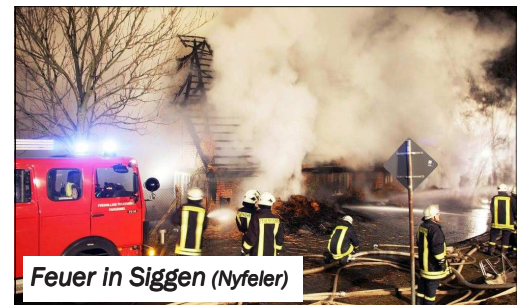
Feuer in Siggen (Nyfeler)

Ein reetgedecktes Haus in Siggen ist komplett niedergebrannt. Bei dem Objekt handelt es sich um ein derzeit unbewohntes Ferienhaus. Im Einsatz waren fünf Feuerwehren. Probleme gab es durch die frostigen Temperaturen: das Löschwasser machte die Straße zu einer Rutschbahn. Auch die Wasserversorgung war schwierig. Brandstiftung kann nicht ausgeschlossen werden.