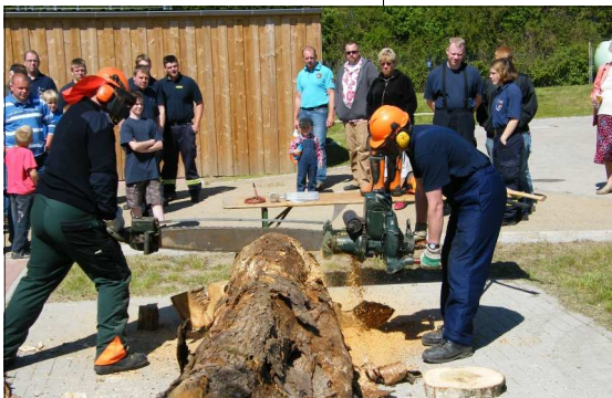
Die Lehrgangssparte „Motorsägenführung“ demonstrierte den Motorsägen-Einsatz