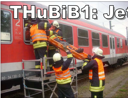
(KfV OH) Beim Lehrgang Technische Hilfe und Brandbekämpfung im Bahnbereich gibt es seit dem Mai eine Änderung.