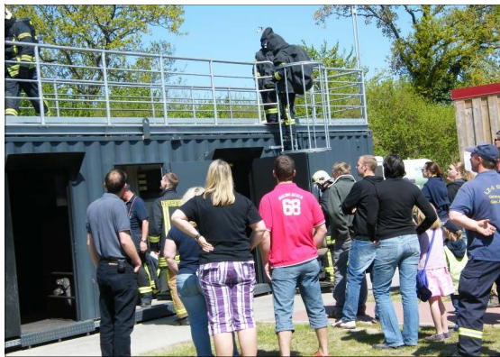
Reges Interesse fanden die Übungen im Brandgewöhnungscontainer