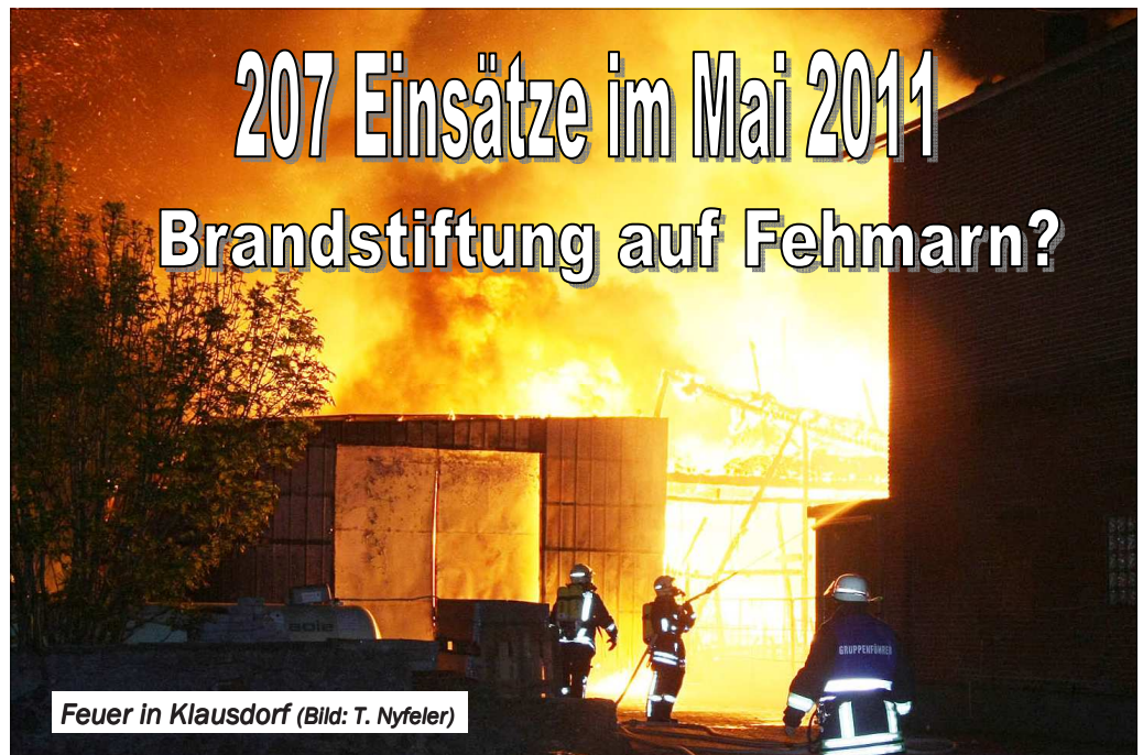
Feuer in Klausdorf

(KfV OH) Mit 207 Einsätzen im Mai 2011 verzeichneten Ostholsteins Feuerwehren einen leichten Anstieg des Einsatzaufkommens gegenüber dem Vormonat.