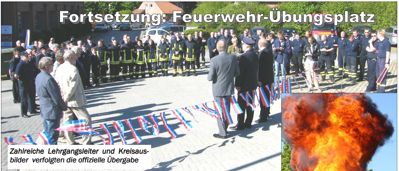
Zahlreiche Lehrgangssleiter und Kreisausbilder verfolgten die offizielle Übergabe