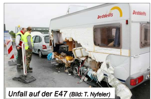
Unfall auf der E47

retten und an Land gebracht werden. Mit einem Schlauchboot versuchte die Feuerwehr das ausgebrannte Boot an Land zu ziehen. Beim Abschleppversuch brach dieses in der Mitte auseinander und versank teilweise. Es konnte noch der Benzintank gesichert werden, so dass keine Umweltgefahr mehr bestand.