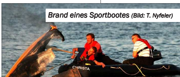
Brand eines Sportbootes