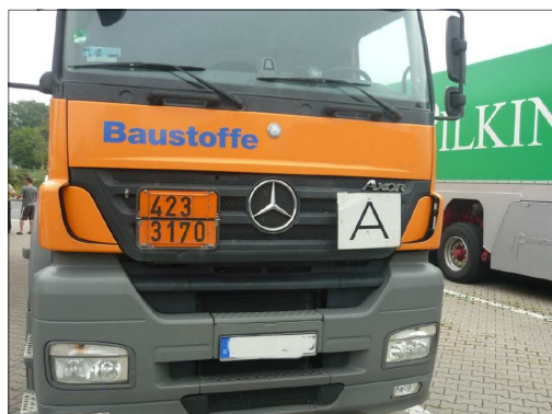
Kennzeichnung des Fahrzeuges nach ADR

(Info Branddirektion Abteilung Einsatz Stuttgart/ 01.08.2011)