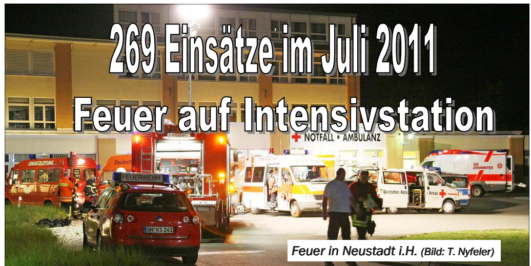
Feuer in Neustadt i.H.

(KFV OH) Wegen eines Feuers auf der Intensivstation der Schön-Klinik Neustadt wurde Großalarm ausgelöst. 140 Rettungskräfte eilten nach Neustadt.