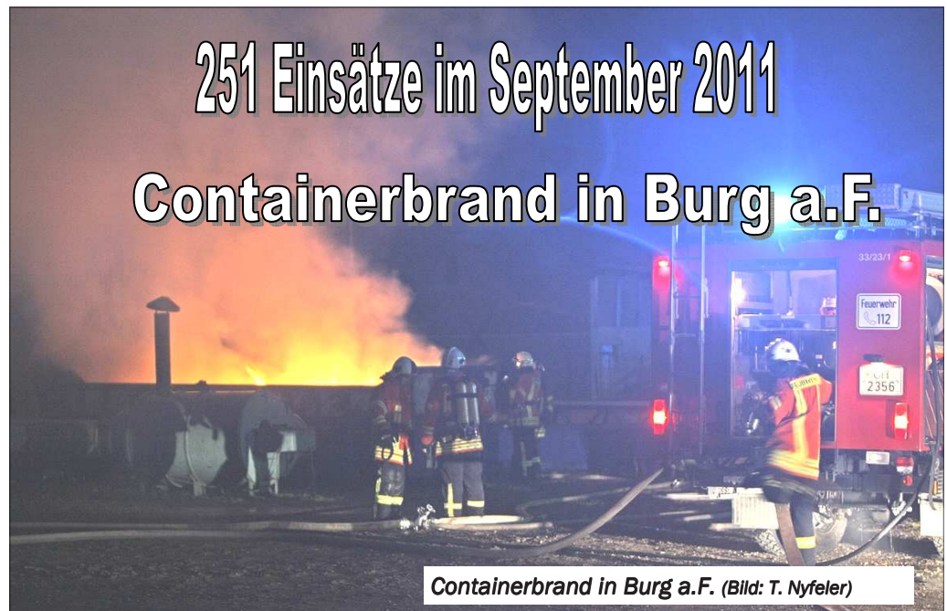
Containerbrand in Burg a.F.

(KfV OH) Und wieder waren es weit über 200 Einsätze. Auch der September war für Ostholsteins Feuerwehren ein einsatzreicher Monat. 251 Einsätze, gegenüber 275 im Vormonat wurden gezählt.