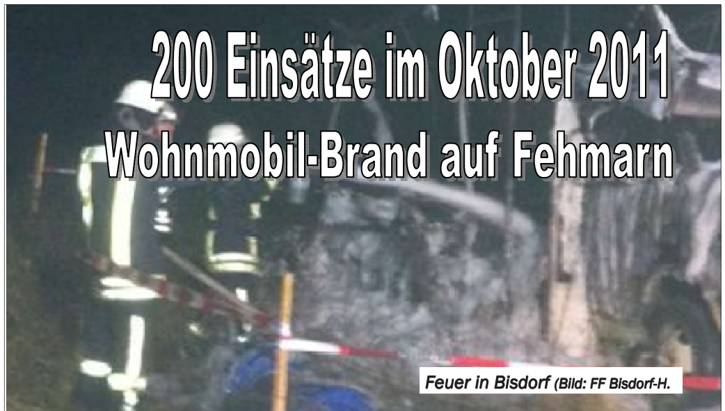
Feuer in Bisdorf

(KfV OH) Gemessen an den Einsatzzahlen der Vormonate verzeichneten Ostholsteins Feuerwehren einen relativ ruhigen Oktober. Exakt 200 Einsätze wurden gemeldet.