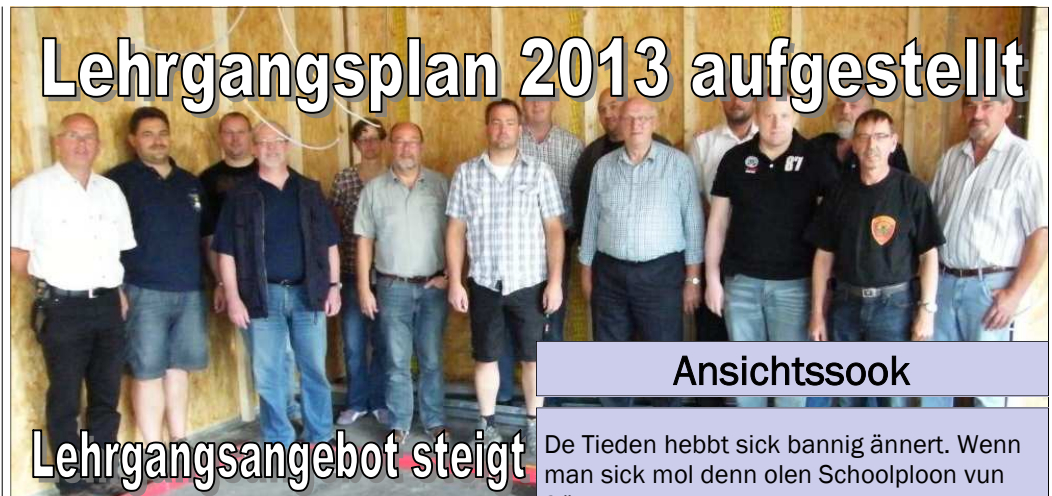
Lehrgangsleiter des KFV OH stellten den Lehrgangsplan 2013 auf

(KFV OH) Die Lehrgangspause war noch nicht beendet, da trafen sich bereits die Lehrgangsleiter des Kreisfeuerwehrverbandes Ostholstein, um den Lehrgangsplan für das Lehrgangsjahr 2013 auf den Weg zu bringen.