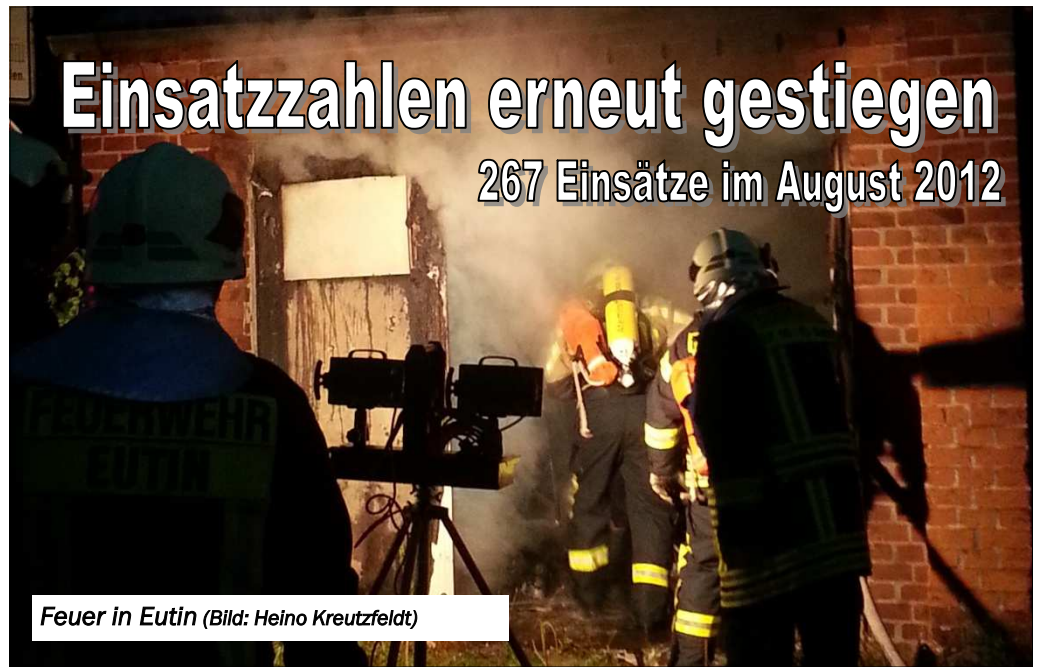
Feuer in Eutin

(KfV OH) Gegenüber dem Juli 2012 sind die Einsatzzahlen im August 2012 erneut gestiegen. 267 Einsätze meldeten Ostholsteins Feuerwehren gegenüber 243 Einsätze im Vormonat.