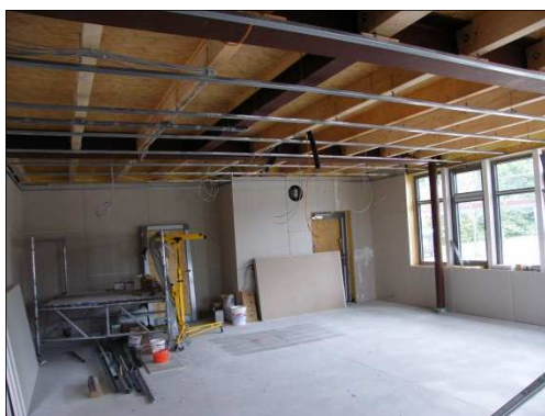
Blick in den Schulungsraum des Erweiterungsbaus (Bild: D. Prüß)

Im gesamten Bau sind die Estricharbeiten abgeschlossen. Der Innenausbau ist bis auf die Deckenverkleidungen im Erdgeschoss fertiggestellt. Leider werden sich wohl die Fliesenarbeiten verzögern, da der Estrich noch nicht hinreichend ausgetrocknet ist. Das Außengerüst soll abgebaut werden. (D.Prüß)