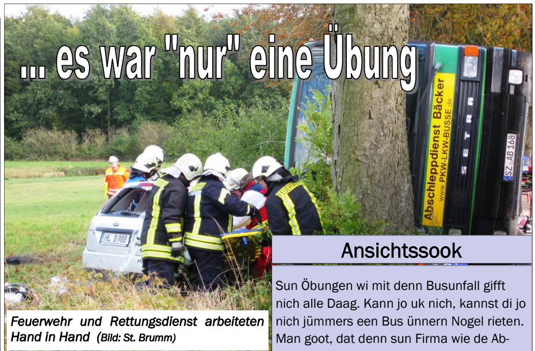
Feuerwehr und Rettungsdienst arbeiteten Hand in Hand

Interesse am Füürwehr-Snack ? Wir versenden auch per Email !