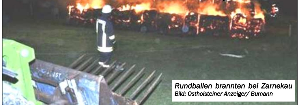
Rundballen brannten bei Zarnekau

(KfV OH) Die Rundballen-Brände in Ostholstein reißen nicht ab. Im September standen dreimal Rundballen in Flammen.