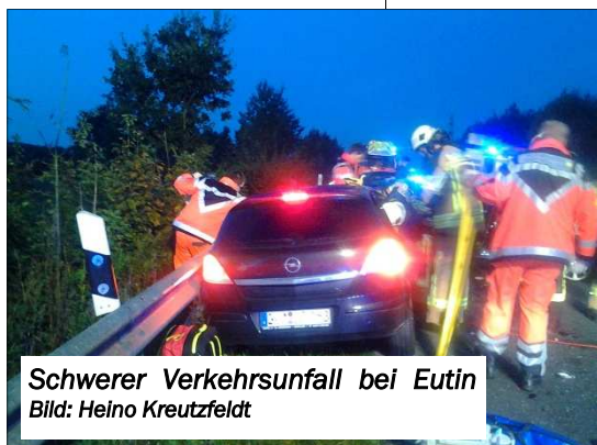
Schwerer Verkehrsunfall bei Eutin