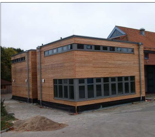
Der Erweiterungsbau der FTZ jetzt ohne Baugerüst. (Bild: D. Prüß)

Mittlerweile wurde das Außengerüst abgebaut und somit ist ein ungestörter Blick auf den Erweiterungsbau möglich. Auch die Innenarbeiten gehen voran. Der Trockenbau ist abgeschlossen und die ersten Fliesenarbeiten im Bereich der Atemschutzwerkstatt wurden vorgenommen. Hier wird jetzt bereits die Atemschutzwerkstatt eingebaut. Mit den Fliesenarbeiten wurden auch bereits die ersten Malerarbeiten vorgenommen. (D.Prüß)