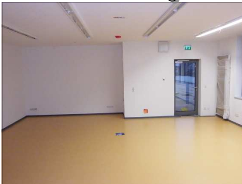
Blick in den neuen Unterrichtsraum