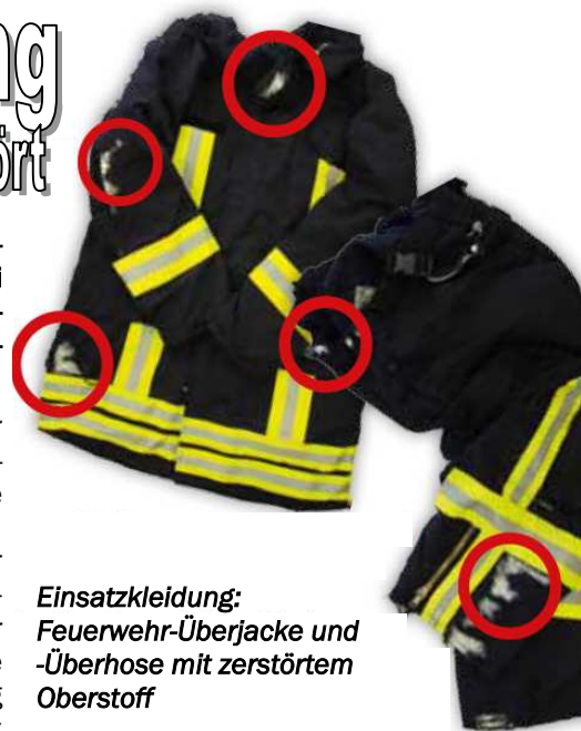
Einsatzkleidung: Feuerwehr-Überjacke und -Überhose mit zerstörtem Oberstoff

Im Etikett der Feuerwehr-Überjacken steht unter Achtung: „Setzen Sie die Überjacke nicht unnötig dem Sonnenlicht aus“. Die Hersteller-Information beschreibt in einer Broschüre unter Prüfung vor dem Gebrauch, Lagerung und Wartung : „Die