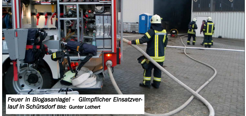
Feuer in Biogasanlage! - Glimpflicher Einsatzverlauf in Schürsdorf

(KfV OH) Gegenüber dem Vormonat verzeichneten Ostholsteins Feuerwehren im April 2013 zwar weniger Einsätze, dennoch wurden wieder über 200 Einsätze gemeldet.