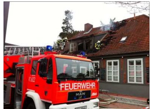
Dachstuhlbrand in Bad Schwartau

gezielt bekämpfen. Der Teleskopmast wurde eingesetzt, um Teile des Daches aufzunehmen und dadurch die Brandkontrolle und Belüftung durchzuführen. Nach gut einer halben Stunde konnte "Feuer aus" gemeldet werden. Zwei Personen wurden an den Rettungsdienst, wegen des Verdachts der Rauchgasintoxikation, übergeben.