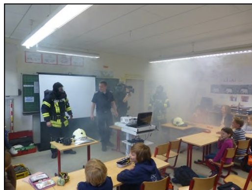
Branderziehungstag an der Grund- und Gemeinschaftsschule Pönitz