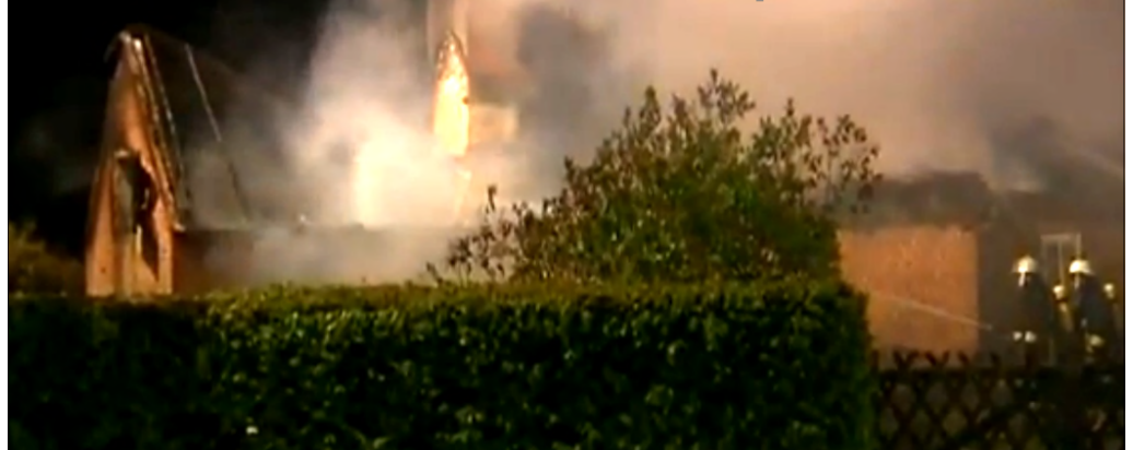
Foto: Großfeuer in Dahme. Ein reetgedecktes Ferienhaus wird ein Opfer der Flammen.

(KfV OH) Erneut verzeichneten Ostholsteins Feuerwehren über 200 Einsätze - insgesamt 212 Einsätze weist die Mai-Statistik aus. Die Brandeinsätze fielen in dem Einsatzmonat relativ gering aus.