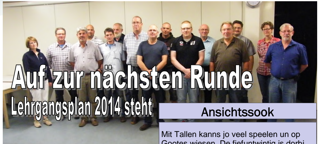
Tagung der Lehrgangleiter am 14.08.2013

Interesse am Füürwehr-Snack ? Wir versenden auch per Email !