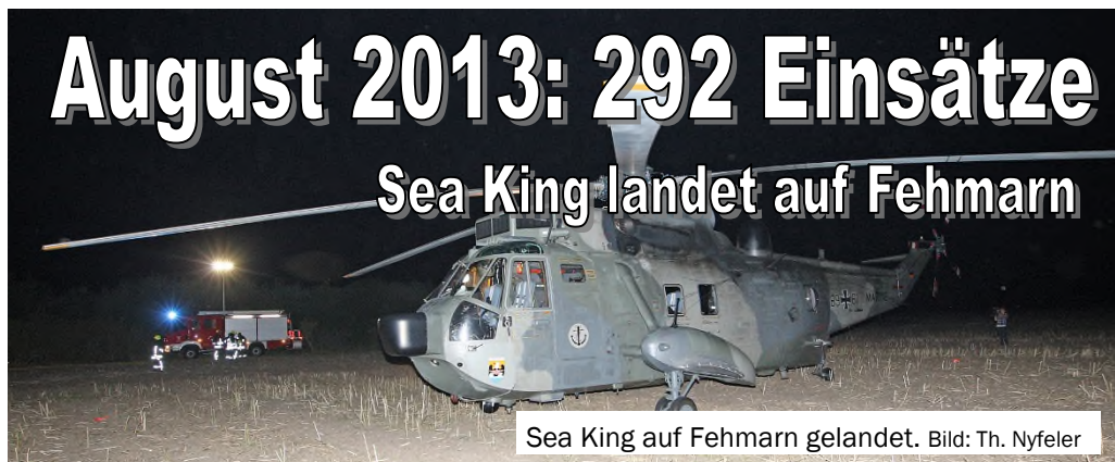
Sea King auf Fehmarn gelandet.

(KfV OH) Einen Anstieg der Einsatzzahlen verzeichneten Ostholsteins Feuerwehren im August gegenüber dem Vormonat. 292 gemeldete Einsätze belegen einen einsatzreichen Monat.