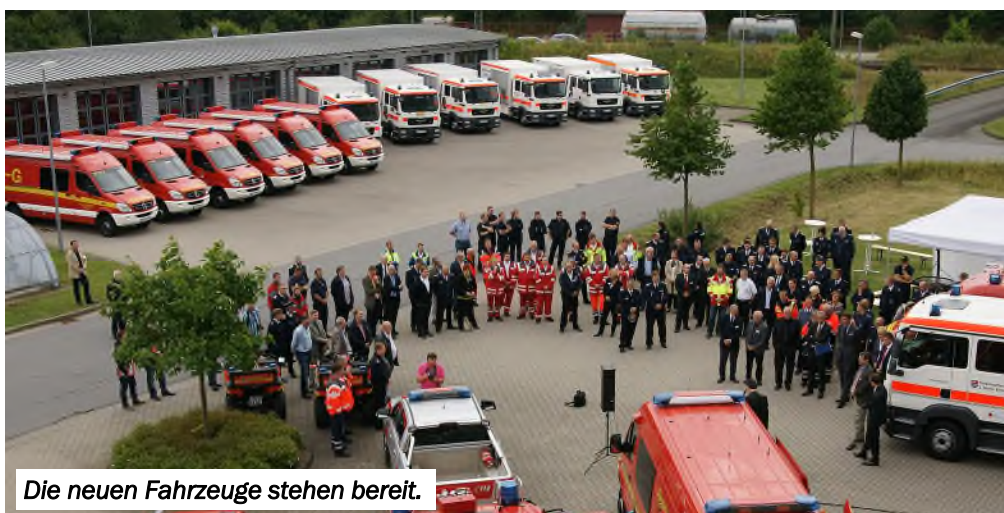
Die neuen Fahrzeuge stehen bereit.