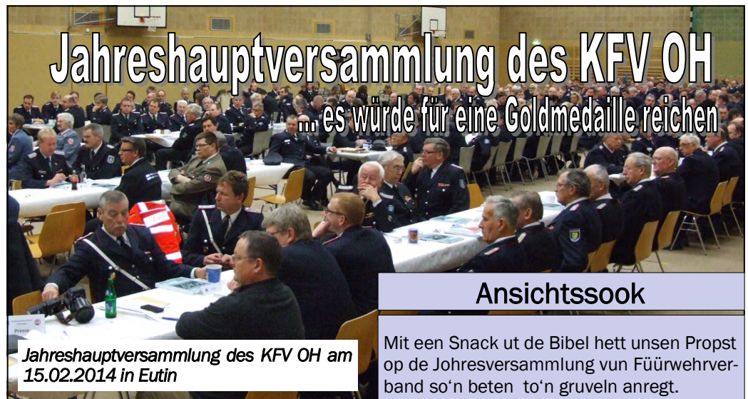
Jahreshauptversammlung des KFV OH am 15.02.2014 in Eutin

Interesse am Füürwehr-Snack ? Wir versenden auch per Email !