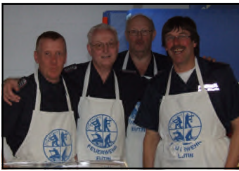
Ein guter Gastgeber waren die Feuerwehren der Stadt Eutin ... DANKE!