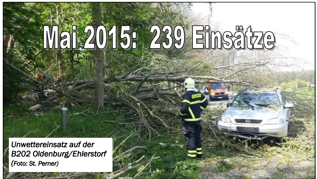
Unwettereinsatz auf der B202 Oldenburg/Ehlerstorf

(KfV OH) 239 Einsätze verzeichneten Ostholsteins Feuerwehren im Mai 2015. Infolge eines kurzen heftigen Unwetters Anfang des Monats verzeichneten die Wehren binnen kürzester Zeit 41 Einsätze.