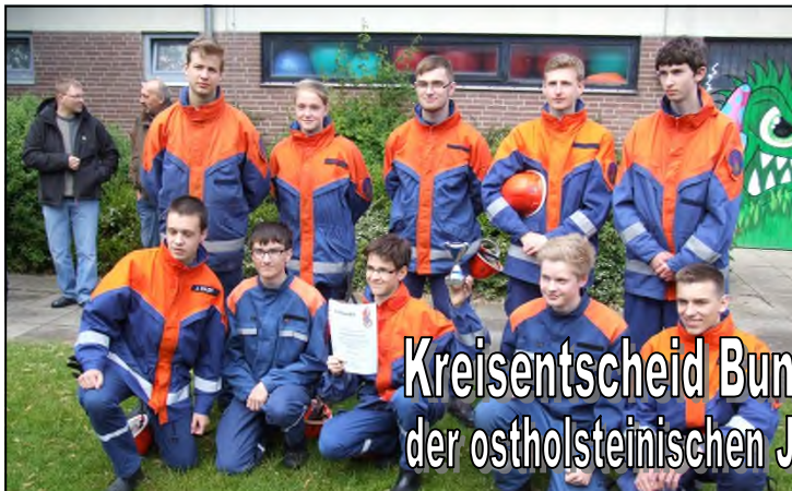
Im Bild: die siegreiche Mannschaft der Jugendfeuerwehr Neustadt i.H.

MITTEILUNGSBLATT DER OSTHOLSTEINISCHEN JUGENDFEUERWEHREN