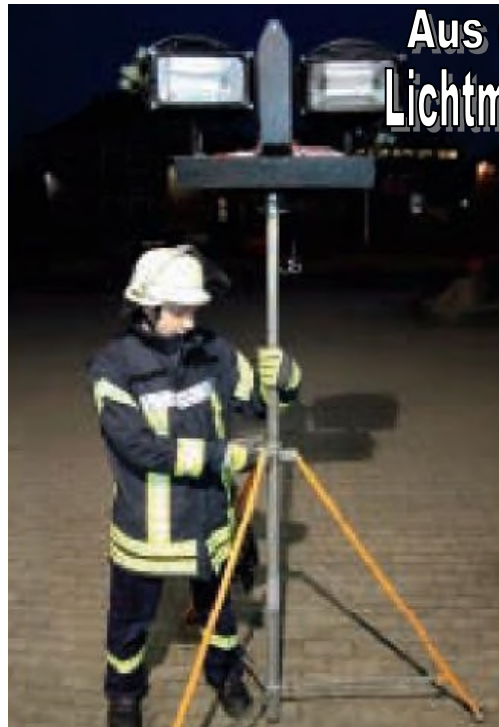
Beim Auf- und Abbau des Scheinwerferstativs drohen z.B. Quetschgefahren. Handschuhe sind Pflicht!

Der Dienstleistungsbericht steht auf der Homepage der HFUK Nord zur Verfügung. ( www.hfuk-nord.de )