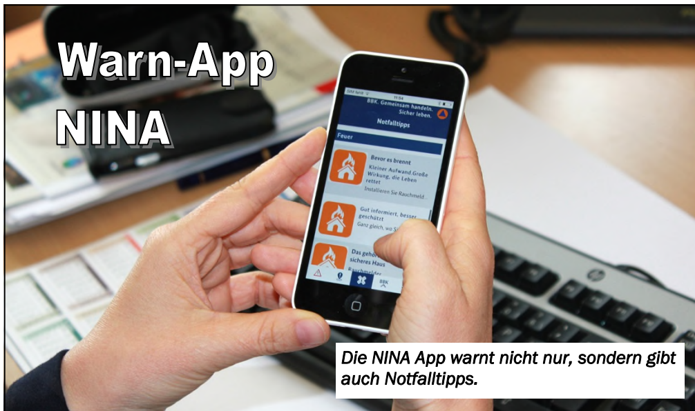
Die NINA App warnt nicht nur, sondern gibt auch Notfalltipps.

(BBK) NINA ist die Notfall-Informations- und Nachrichten-App des Bundesamtes für Bevölkerungsschutz und Katastrophenhilfe (BBK). NINA warnt Sie deutschlandweit und – wenn Sie dies wünschen – standortbezogen vor Gefahren, wie z. B. Unwettern, Hochwasser und anderen sogenannten Großschadenslagen.