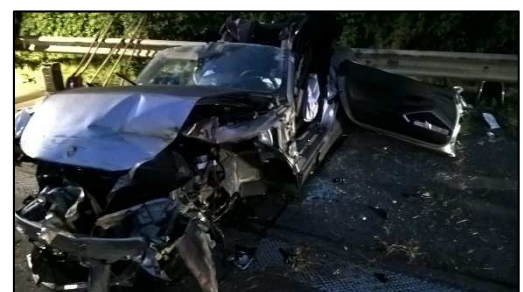
Verkehrsunfall auf der BAB1 durch die Autobahnpolizei für ca. 2 Stunden komplett gesperrt.

Auf der A1 in Höhe der Autobahnauffahrt Sereetz verlor ein Autofahrer die Kontrolle über seinen Porsche und schlug mit etwa 250 km/h gegen die Leitplanke. Fahrzeugteile waren in einem Umkreis von 250 m verteilt, die Seitenleitplanke und eine Lärmschutzwand durchschlugen. Die Freiwillige Feuerwehr Sereetz konnte den eingeklemmten Fahrer mit hydraulischem Werkzeug aus seinem Fahrzeug befreien und dem Rettungsdienst übergeben. Neben der Menschenrettung galt es den Brandschutz sicherzustellen, die Einsatzstelle auszuleuchten, auslaufenden Betriebsstoffen aufzunehmen und die Trümmer von der Fahrbahn zu beseitigen. Die Autobahn A1 wurde in Richtung Norden