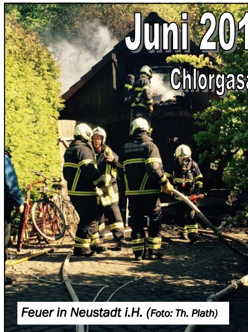
Feuer in Neustadt i.H.

(KfV OH) Mit 186 Einsätzen verzeichneten Ostholsteins Feuerwehren im Juni 2015 einen durchschnittlichen Einsatzmonat.