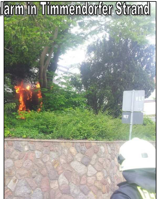
Feuer in Eutin

Zum Brand eines Trafohäuschens wurde die FF Eutin gerufen. Da der Strom noch nicht abgeschaltet war, konnte zunächst kein direkter Löschangriff erfolgen. So wurden zunächst die in nächster Nähe stehenden Bäume geschützt. Als die Rückmeldung eintraf, dass der Strom abgeschaltet ist, wurden die Löscharbeiten vorgenommen.