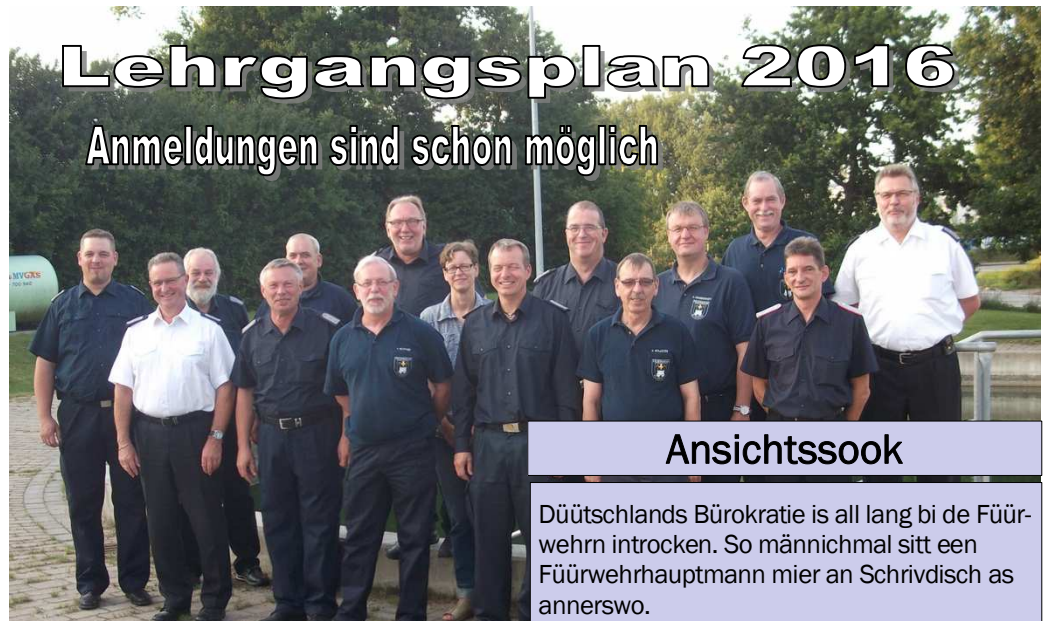
Die Lehrgangleiter beim Kreisfeuerwehrverband Ostholstein haben die Lehrgangsplanung 2016 aufgestellt.

Interesse am Fürwehr-Snack ? Wir versenden auch per Email !