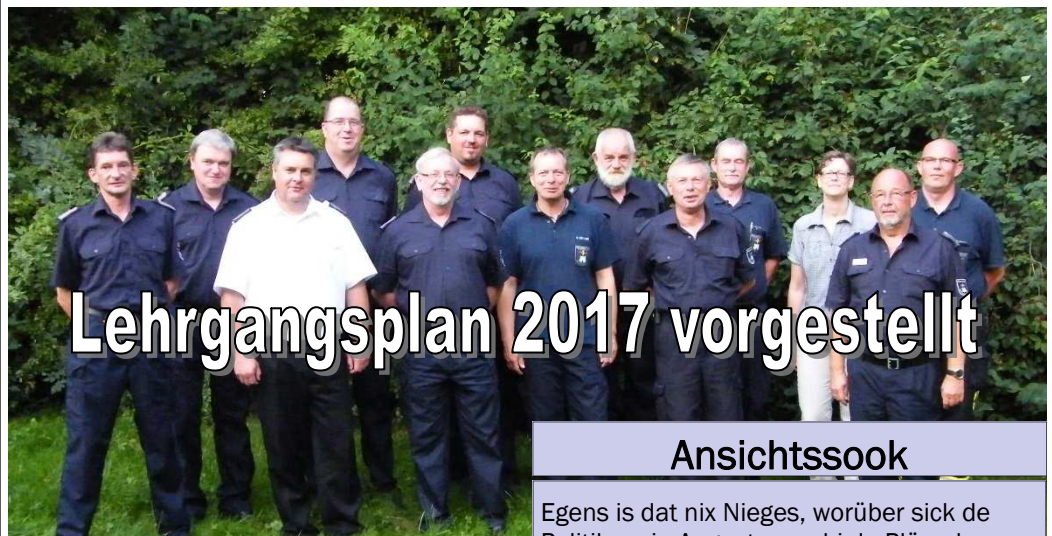
Tagung der Lehrgangslleiter am 22.07.2016 in der FTZ OH