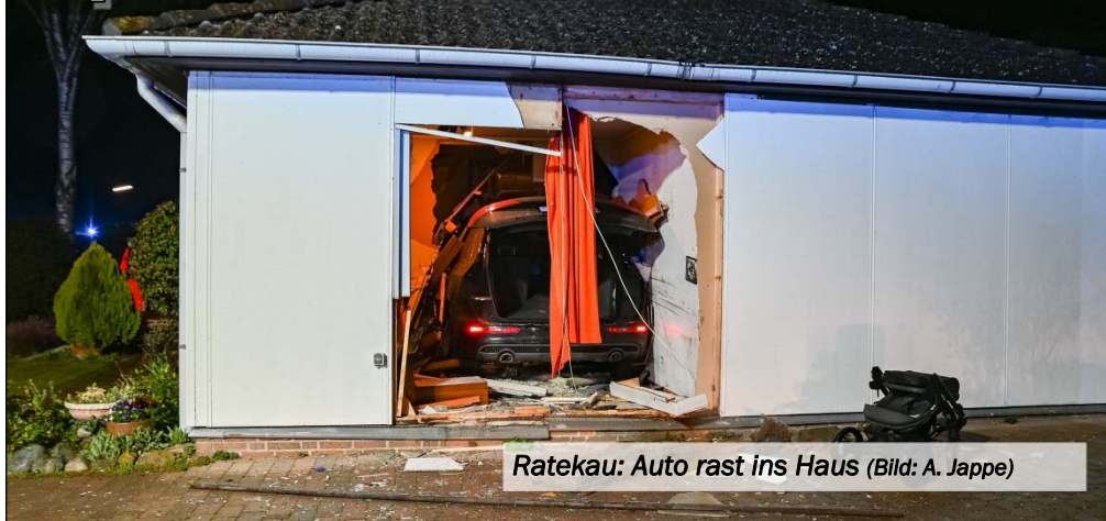
Ratekau: Auto rast ins Haus

(KfV OH) Einen Rückgang der Einsatzzahlen meldeten die Feuerwehren im April 2021. 180 Einsätze wurden gezählt.