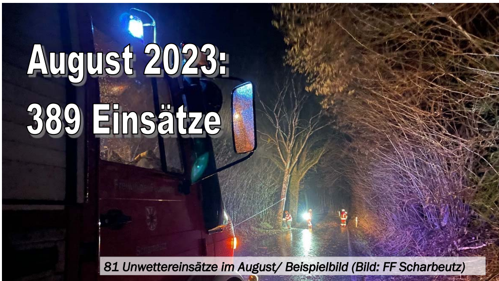
81 Unwettereinsätze im August/ Beispielbild

(KFV OH) Im Monat August 2023 verzeichnet Ostholstein erneut hohe Einsatzzahlen. 389 Einsätze wurden von Ostholsteins Feuerwehren gemeldet.