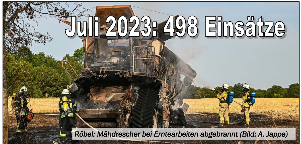
Röbel: Mähdrescher bei Erntearbeiten abgebrannt

(KfV OH) Im Monat Juli 2023 stiegen die Einsatzzahlen gegenüber den Vormonaten sprunghaft an. Viele Flächenbrände und Unwettereinsätze waren der Grund für den Anstieg der Einsatzzahlen. 498 Einsätze meldeten Ostholsteins Feuerwehren insgesamt.