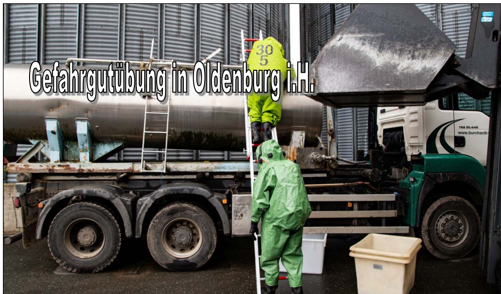
Gefahrgutübung in Oldenburg i.H.

(Oldenburg i.H.) Nur einen Tag nach einem Realeinsatz in Oldenburg i.H. rückten schon wieder mehrere Feuerwehren aus dem ganzen Kreis Ostholstein zu einem Gefahrgutunfall aus.